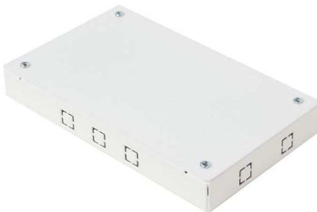
Рисунок 1 - Общий вид коммутационной коробки КК-2756

1.2 Общий вид коммутационной коробки, показан на рисунке 1.