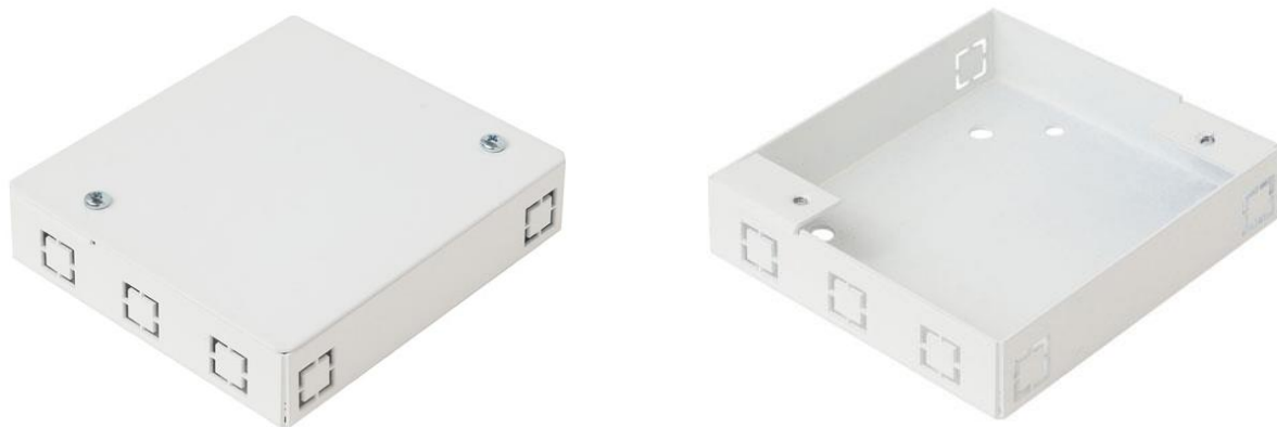
Рисунок 1 - Общий вид коммутационной коробки КК-2757

1.2 Общий вид коммутационной коробки, показан на рисунке 1.