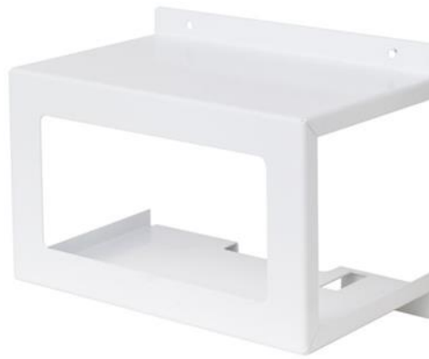
Рисунок 1 - Общий вид защитного кожуха

1.2 Общий вид защитного кожуха показан на рисунке 1.