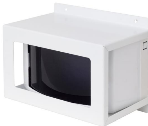
Рисунок 3 - Общий вид извещателя, защищенного кожухом

Общий вид извещателя, защищенного кожухом, показан на рисунке 3.